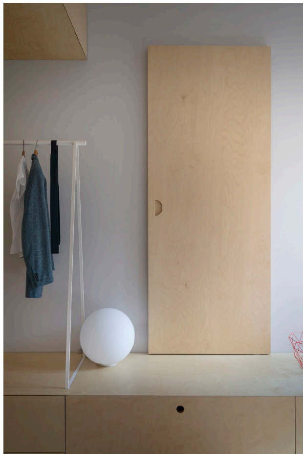
#AMP 2017 Casa per un fisico dell'antimateria